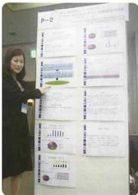
◀ 1年間の転倒発生状況と関連要因の調査